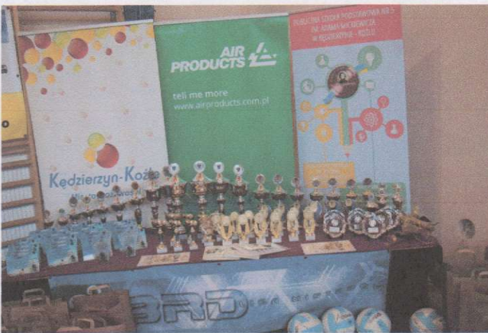
Puchary, statuetki i podziękowania