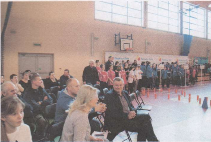
Zaproszeni goście – rozpoczęcie turnieju.