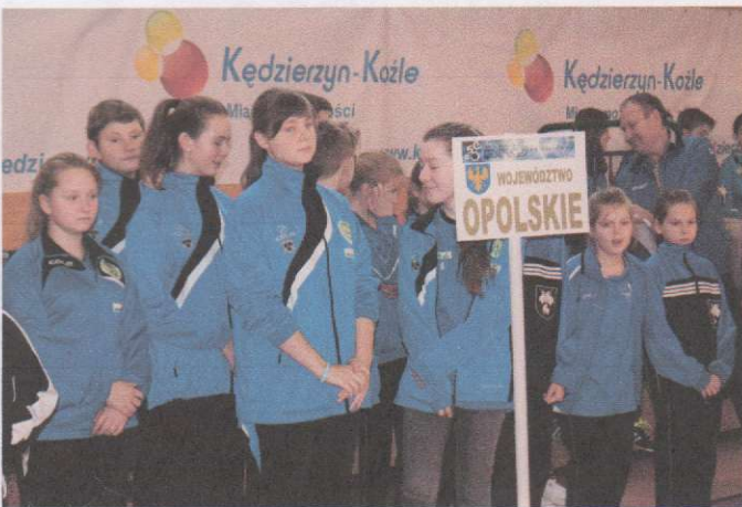
Zawodnicy i zawodniczki reprezentujące Kędzierzyn - Koźle na turnieju.