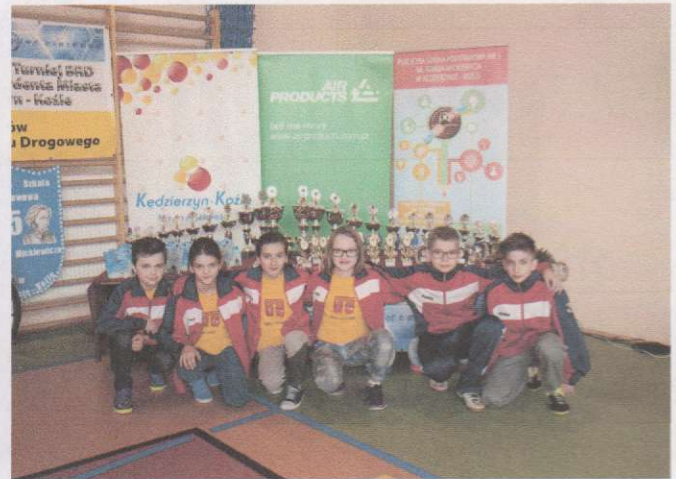
Drużyna reprezentująca Kędzierzyn – Koźle